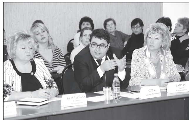
Представители областной организации профсоюза работников здравоохранения РФ назвали готовящиеся изменения в пенсионной системе «не взвешенной реформой, когда меняются отдельные элементы системы, а революцией, ломающей всю её модель».