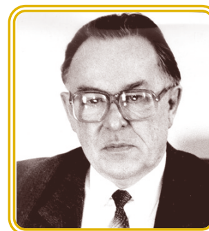
А. ЛАПТЕВ Глава администрации Ивановской области