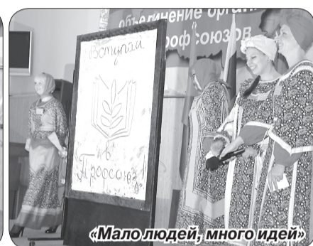
«Мало людей, много идей»