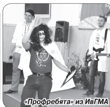
«Профреша» из ИвГМА