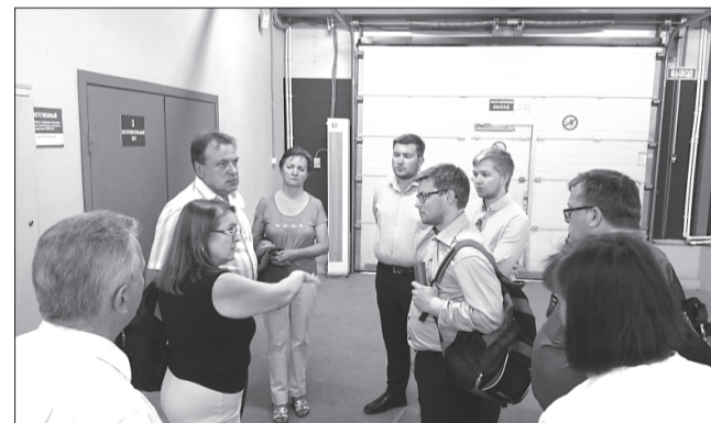
Посещение предприятия ОАО «Газпром-газораспределение» (г. Кострома)

Второй день семинара был посвящён практической работе. Норвежцы большое внимание уделяют средствам массовой коммуникации, социальным сетям, поэтому командам было предложено создать видеоклип на мобильном телефоне, в котором рассказывалось бы о необходимости вступления в профсоюз. На всё это отводилось 10 минут. Все команды «креативили» по полной. Норвежцы были удивлены скоростью и качеством выполнения поставленных заданий российскими коллегами, признаваясь, что в Норвегии молодым членам профсоюза на это потребовалось бы гораздо больше времени. Видеоклипы получились замечательные, их можно посмотреть на сайте Ивановской областной организации Профсоюза.