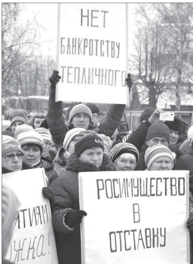
Митинг против закрытия градообразующего предприятия ООО «Совхоз Тепличный». Ново-Талицы, 1 декабря 2014 года

Полина САМОЙЛОВА, сайт центральной профсоюзной газеты «Солидарность»