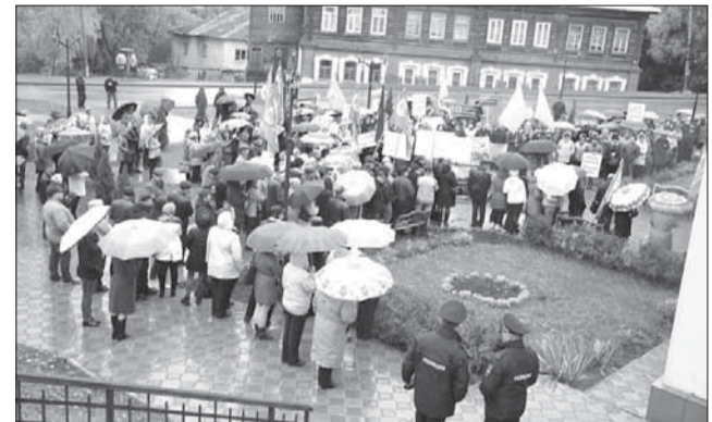
Митинг в Наволоках против строительства межуниципального полигона ТБО. 7 октября 2016 года

А что же на самом деле происходит в городах, с которыми работает Фонд?