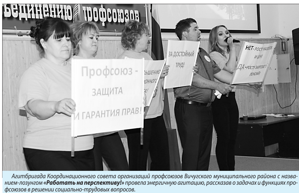
Агитбригада Координационного совета организаций профсоюзов Вичугского муниципального района с названием-лозунгом «Работать на перспективу!» провела энергичную агитацию, рассказав о задачах и функциях профсоюзов в решении социально-трудовых вопросов.

Общественно-политическое издание «Профсоюзная защита» Учредитель: Региональный союз «Ивановское областное объединение организаций профсоюзов» Главный редактор: М. С. Леонов Адрес редакции (издателя): 153002, г. Иваново, пр. Ленина, 92, к. 29, тел. 30-18-32. E-mail: gazeta-ivprof@yandex.ru; сайт: ivanovo-prof.ru