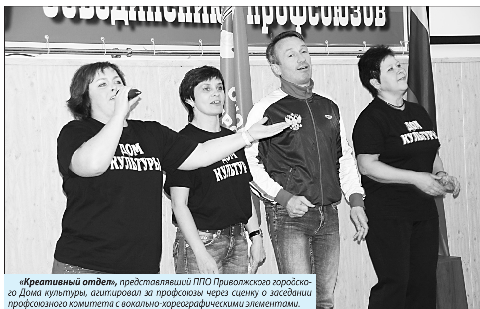
«Креативный отдел», представлявший ППО Приволжского городского Дома культуры, агитировал за профсоюзы через сценку о заседании профсоюзного комитета с вокально-хореографическими элементами.