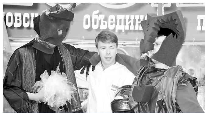
Необычной и креативной «Профсоюзной одиссеей 2018 года» впечатлили зрителей ребята из ППО Ивановской государственной сельскохозяйственной академии. По сюжету их номера, профсоюзный активист отправляется в путешествие по космическим далям, находит среди звёзд планету с разумной жизнью и «модернизирует» уклад местных аборигенов с помощью Профсоюза.