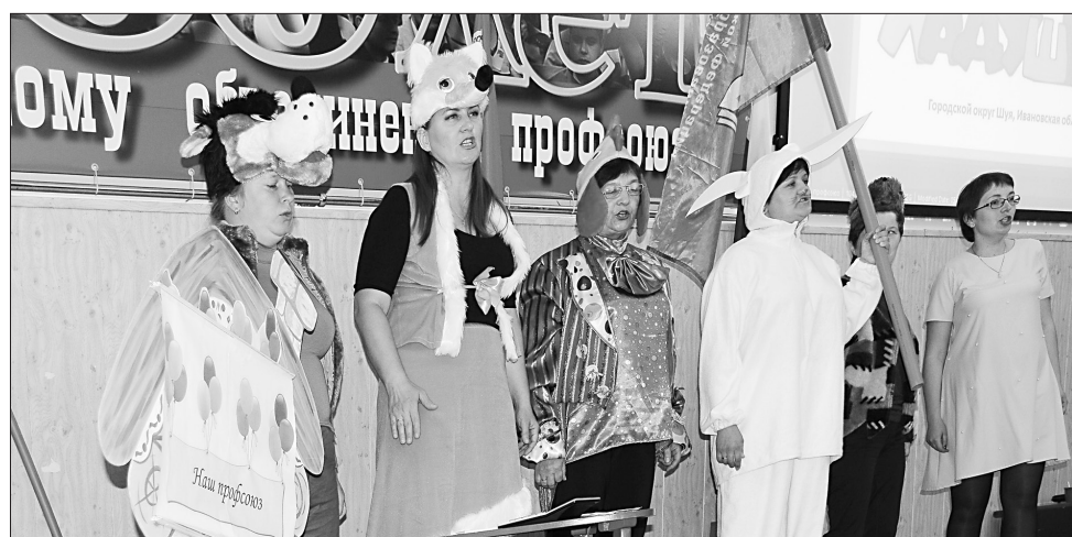
Театрализованное выступление команды «Ладушки» (ППО Центра развития ребёнка – детского сада №4 городского округа Шуя) запомнилось костюмами обитателей леса – уволенного с работы Зайца, ищущего защиты своих прав перед хитрой начальницей Лисой, юриста Волка, работающего только за деньги, и других персонажей, которые в итоге объединились в профсоюзную организацию под песню.