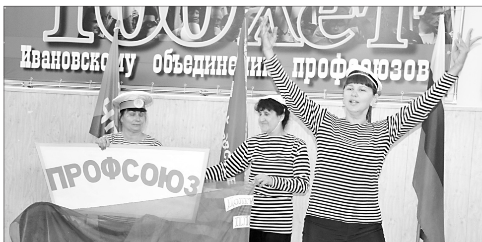
Команда «Спасательный круг» (ППО детского сада комбинированного вида №64 города Иванова) показала агитационную мини-театр о спасении Профсоюзом «моряка», тонущего в море социальной несправедливости и ущемлённых трудовых прав.