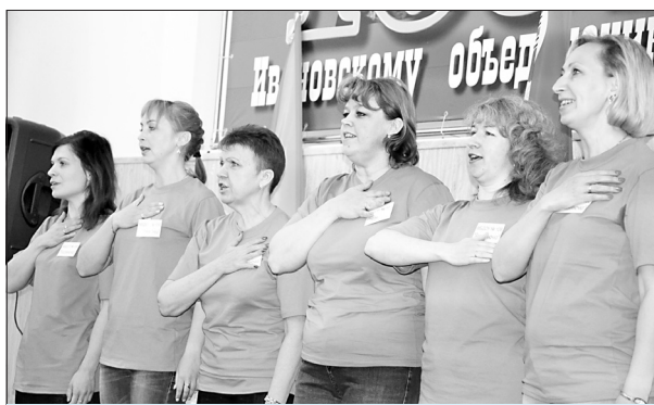
Конкурсные выступления начались с агитбригады «Россияночка» (ППО детского сада комбинированного вида №108 города Иванова), которая спела несколько бодрых песен и частушек о плюсах членства в профсоюзах, выразив свою солидарность и приверженность профсоюзному движению и его идеем.