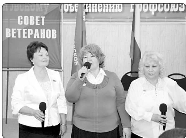
Агитбригада ветеранов ИОООП