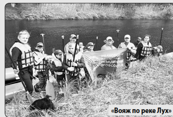
«Вояж по реке Лух»