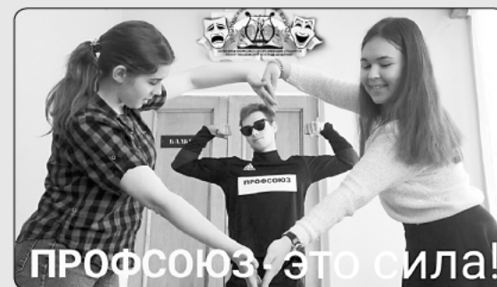
ПРОФСОЮЗ – ЭТО СИЛА!