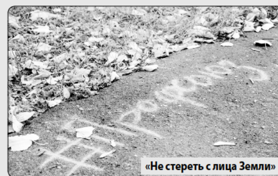
«Не стереть с лица Земли»