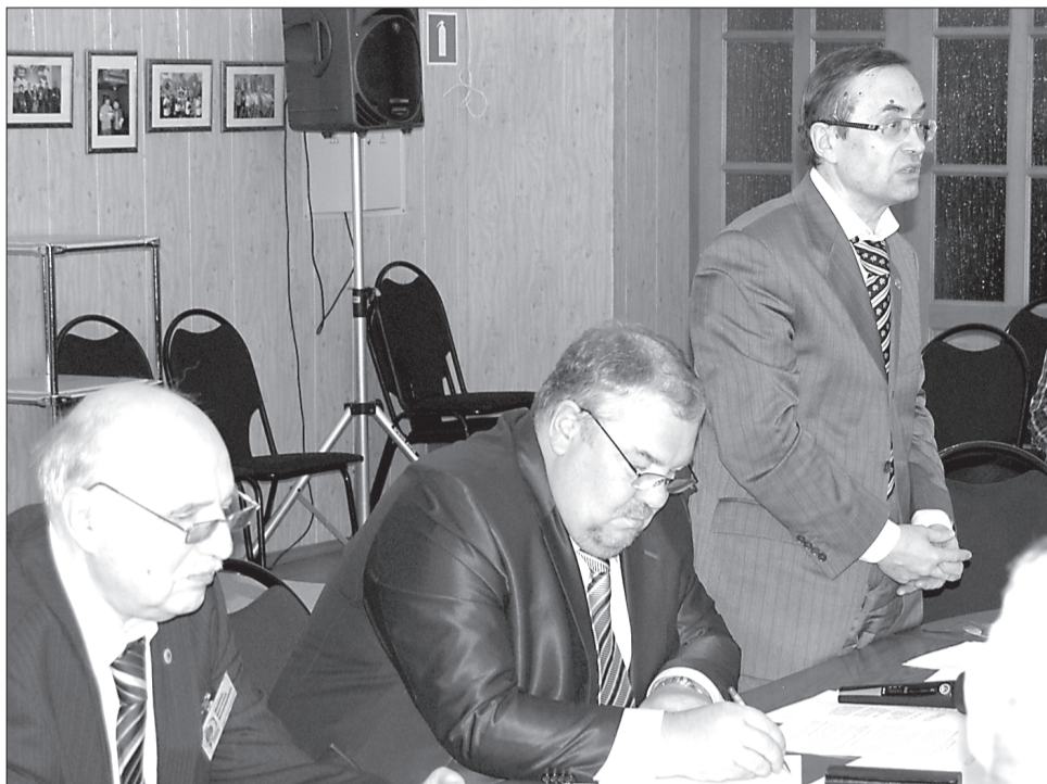
Доклад нижегородского гостя вызвал бурные обсуждения

«Wolksvagen», к примеру, рабочим позволяют с сохранением зарплаты часы для того, чтобы они изучали новое оборудование и совершенствовались лично-