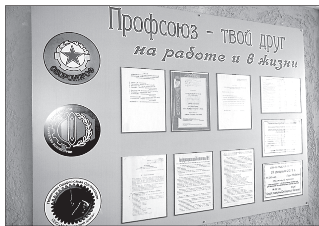
Информационные стенды завода постоянно обновляются