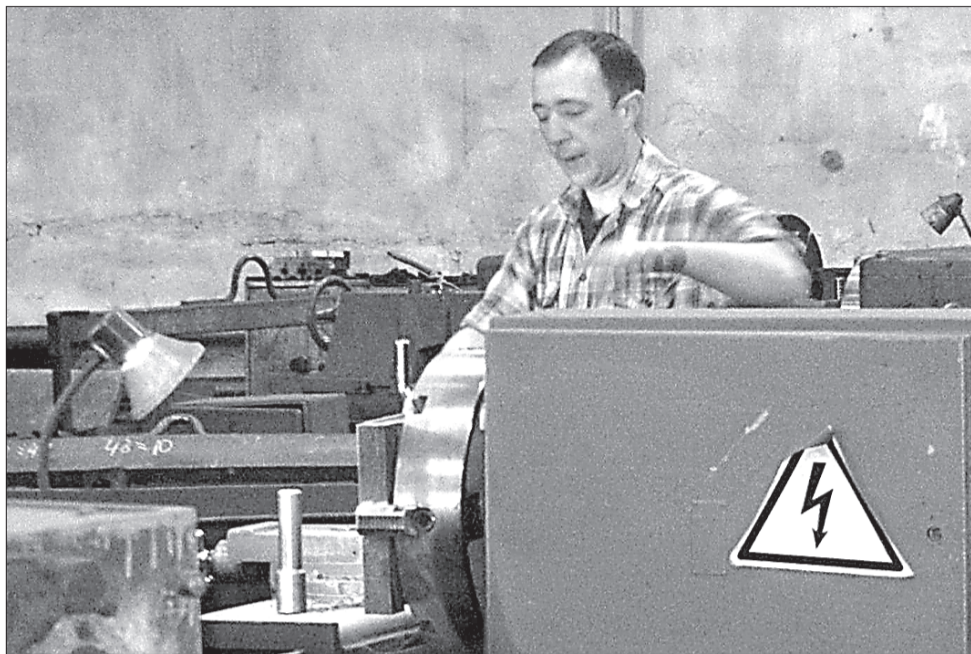
В настоящее время производство ожидает модернизация.

ООО «Майдаковский завод», расположенный в одноимённом селе Палехского района, и насчитывающий более 140 лет истории существования, является примечательным случаем того, как налаженная работа первичной профсоюзной организации в купе с понимающим и готовым к сотрудничеству руководством обеспечивают высокий уровень защиты трудовых прав и интересов сотрудников предприятия.