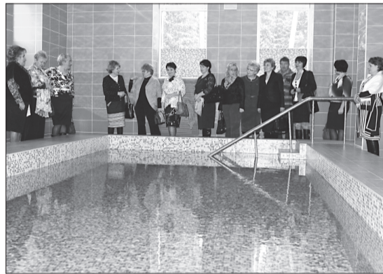
Некоторые из новинок «Оболсунова»: бассейн и соляная микроклиматическая палата

Участники семинара поблагодарили за гостеприимный приём и высказали положительные отзывы о развитости материально-технической базы здравницы и широте предоставляемых услуг.