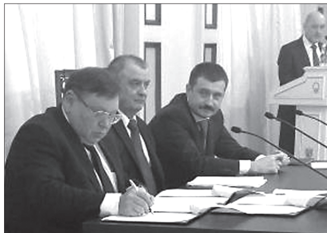
В качестве одного из представителей органов исполнительной власти субъектов ЦФО, подписавших 12 декабря Соглашение, выступил и.о. губернатора Ивановской области Павел КОНЬКОВ

Использованы материалы Департамента общественных связей ФНПР