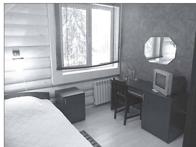
Как можно видеть по снимкам, новый «лесной домик» в «Зелёном городке» значительно превосходит размерами своих более старших «соседей»

своих услуг новую позицию – соляную микроклиматическую палату «СИЛЬВИН» (по названию природного минерала сильвинита, из которого она сделана). Аналогов «СИЛЬВИНА» в Ивановской области нет. Микроклиматическая палата обладает комплексом