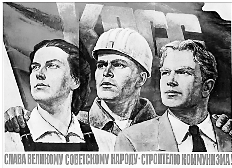
СЛАВА ВЕЛИКОМУ СОВЕТСКОМУ НАРОДУ-СТРОИТЕЛЮ КОММУНИЗМА!