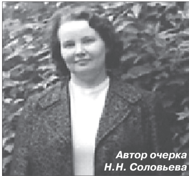
Автор очерка Н.Н. Соловьёва

Мама или тётя повторяли этот рассказ в тех или иных вариациях для каждой входящей в дом соседки. Женщины сходу принимались расспрашивать папу и, в основном, об одном: не встречал ли он на войне их мужей, не слышал ли о них? Отец виновато разводил руками: «Не видел, не слышал. Да ведь фронт-то большой!» Соседка рухнула на табуретку. В отчаянии