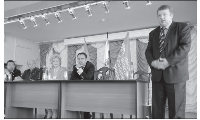
В торжественном заседании в Кинешме приняли участие многие общественные организации и представители властных органов

торжественной части участники встречи осмотрели «Музей кукол» при районном Детско-юношеском центре, работы в котором выполнены детьми членов профсоюзов.