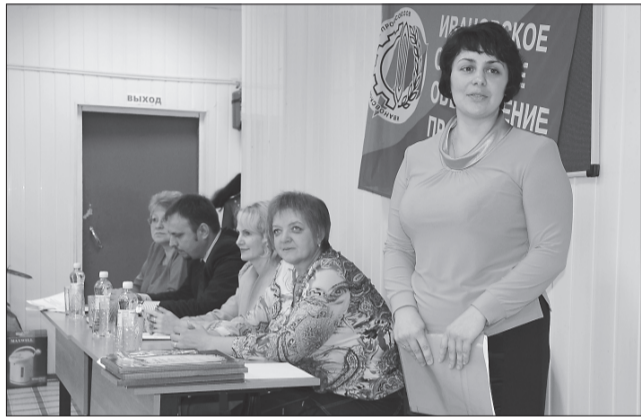
На мероприятии в Юже поздравляли и награждали молодых членов профсоюзов

Много поздравлений было и в адрес ветеранов профдвижения. В завершении для них был организован небольшой музыкальный подарок – вокальные и танцевальные номера.