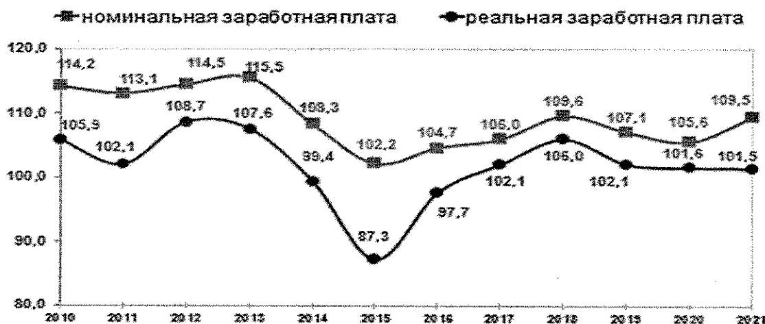
СРЕДНЕМЕСЯЧНАЯ ЗАРАБОТНАЯ ПЛАТА В ИВАНОВСКОЙ ОБЛАСТИ В 2010-2021 ГОДАХ (ТЫС.РУБ.)*